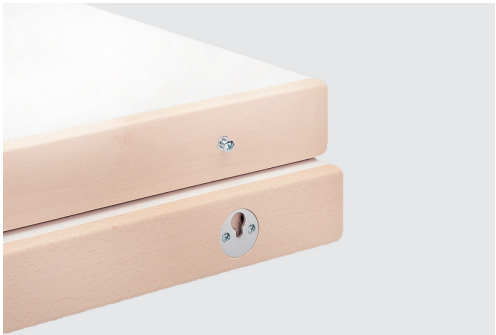
liaison des plateaux intermédiaires connection of intermediate table tops