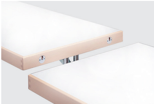
plateaux intermédiaires intermediate table tops

patins réglables en hauteur height-adjustable glider