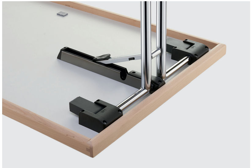
ferrure rabattable avec cale d'empilage à sortie automatique hinge element with automatically upwards moving bearing block