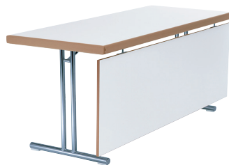
voile de fond screen