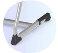
Schützt Boden und Stuhl: ASS-Bodenschoner