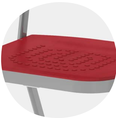
Absolut robustes Gestell dank 2 mm starkem Stahlrohr und durchgängigen Schweißnähten