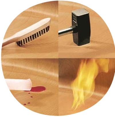
Unverwüstliche WOODPLAC-Schale, kratz-, bruch-, stoßfest & schwer entflammbar