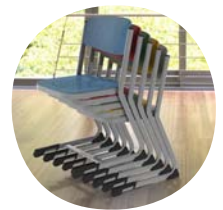
Bis zu 5 Stühle stapelbar