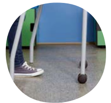
Optional: fahrbar mit 2 Rollen