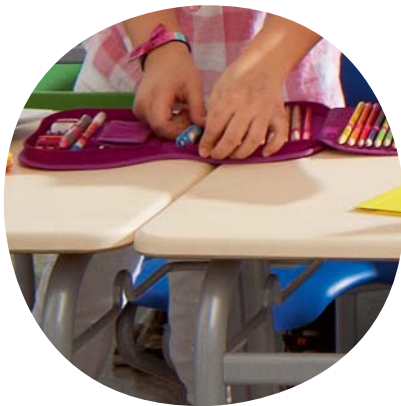
Fugenlos nebeneinander zu stellen (trotz Stapelfähigkeit)