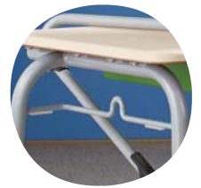
Stapelsteg mit Mappenhaken beidseitig