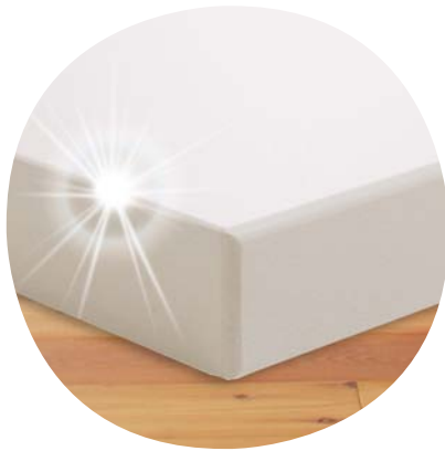
Tischplatte mit mehrlagiger Melaminharzbeschichtung und haltbarer Kunststoffkante