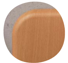
Optional mit WOODMARK®-Platte