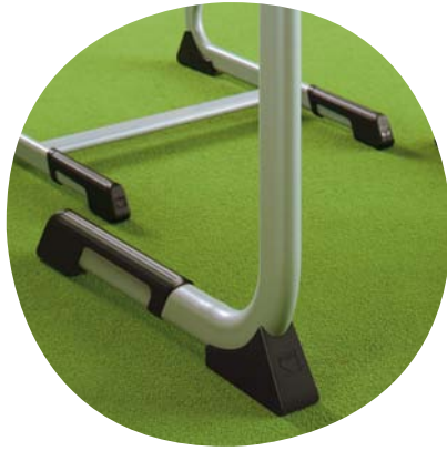
Bodenschoner mit extra langem Trittschutz schützt das Gestell vor Verkratzen