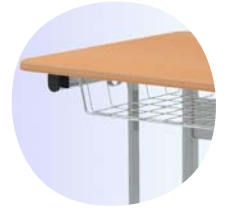
Optional mit Buchablage