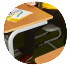
Durch C-Form: seitliches Ein- und Aussteigen